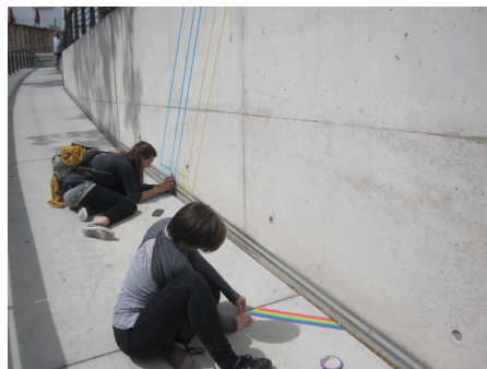
Strategien im öffentlichen Raum

https://www.kunst-uni-siegen.de/studieninteressierte/